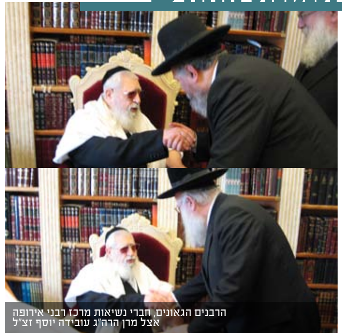
הרבנים הגאונים, חברי נשיאות מרכז רבני אירופה אצל מרן הרה"ג עובדיה יוסף זצ"ל

ביצחו ארזלים את המצוקים ונשיבה ארוך ה' יחד עם כל בית ישראל, חברי מועצת רבני אירופה ורבני הקהילות ברחבי אירופה אבלים, כואבים ומנכים מרה את פשירתו של מאור התורה וההלכה